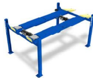
Mostrado con Gatos tipo Rolling Jacks opcionales