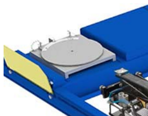
Platos de rotación frontales